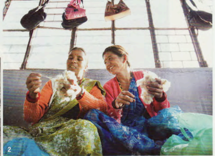
1 Almora liegt in einer abgelegenen Bergregion auf über 1600 Meter Höhe 2, 4, 5 Jede der Frauen führt einen bestimmten Produktionsschritt aus – vom Aufbereiten der Kaschmirwolle über das Weben bis hin zum Besticken der Schals 3 Für die Kashmiri-Stickereien werden ausschließlich feinste und von Hand gefärbte Kaschmir- und Seidengarne verwendet